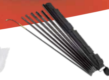
XL 8 S Lance télescopique (7 m) No.d'art. 11935801