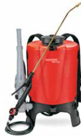
RPD 15 AD1 No.d'art. 12117301