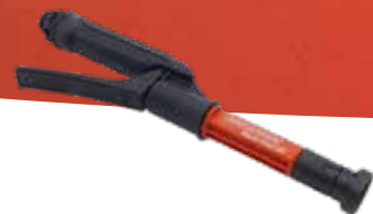
Vario Gun No.d'art. 11558501