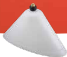
Capot de protection ovale No.d'art. 10501606