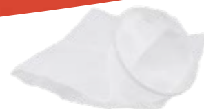
Sac filtrant bio No.d'art. 11475701