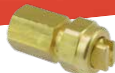
Buse à jet plat No.d'art. 11612810