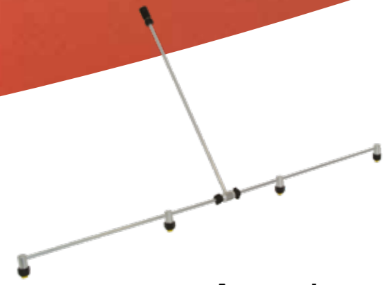
Rampe de pulvérisation en aluminium No.d'art. 11889501-SB