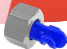
Herbicide floodjet buse No.d'art. 10501803-SB